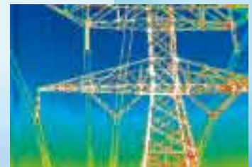
Transporte y distribución eléctrica